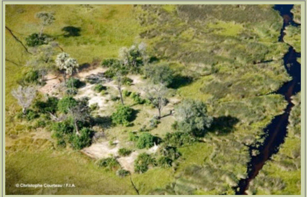
FOOTSTEPS IN AFRICA - BOTSWANA MADE EINFACH & PREISWERT