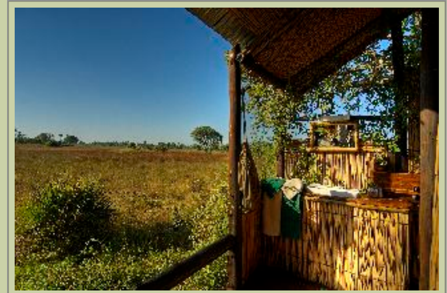
Suite - Badezimmer