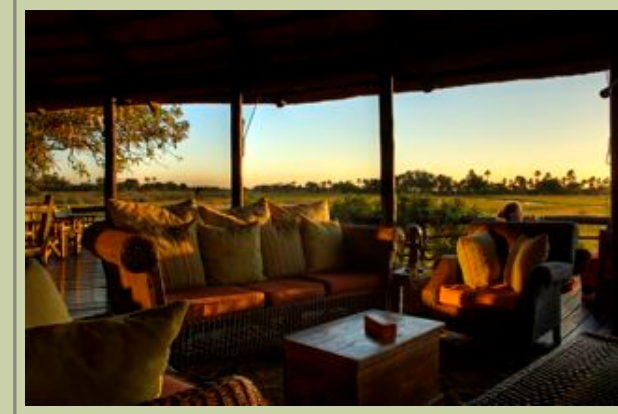
Hauptkomplex - Interior