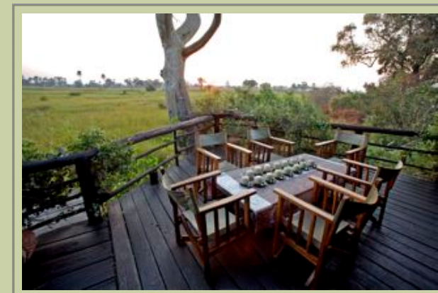
Hauptkomplex - Teeveranda