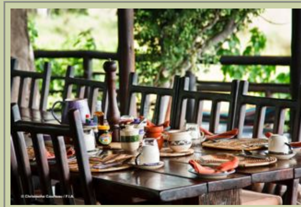
Hauptkomplex - Essbereich