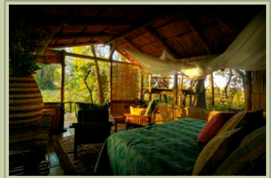
Suite - Zimmer

PREISE: Preise mit Vollpension inklusive aller lokalen Getränke und Aktivitäten.