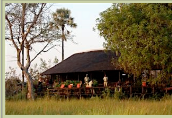
Hauptkomplex - Exterior

Die Wahl an frischem Gemüse, Käse, vorzüglichen Fleischsorten und feinem Wein, täglich eingeflogen und liebevoll zubereitet, erhalten den beneidenswerten Ruf des