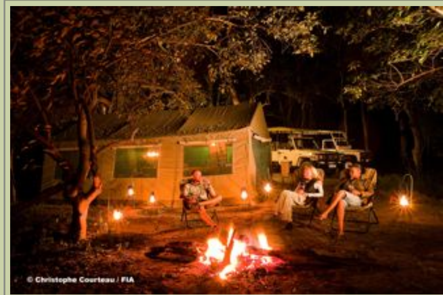
Hauptzelt - Ansicht