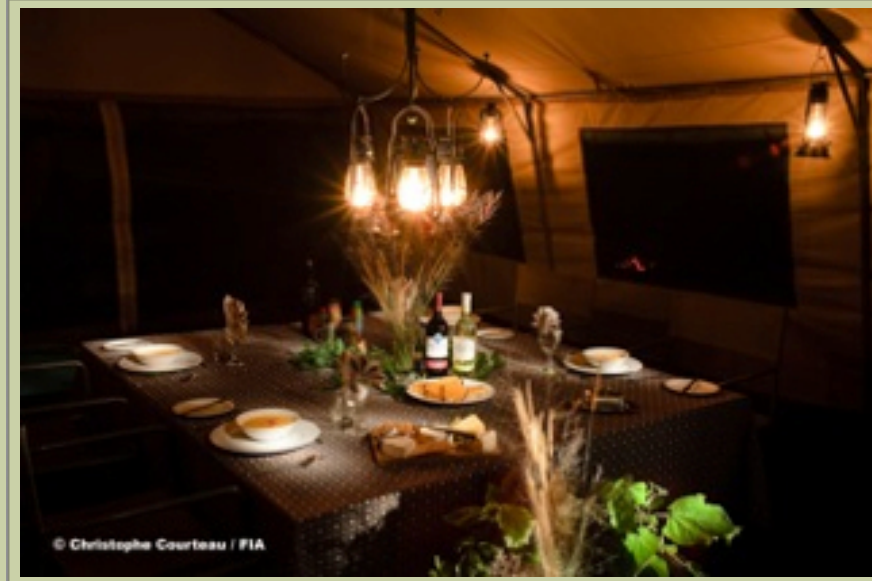
Hauptzelt - Interior