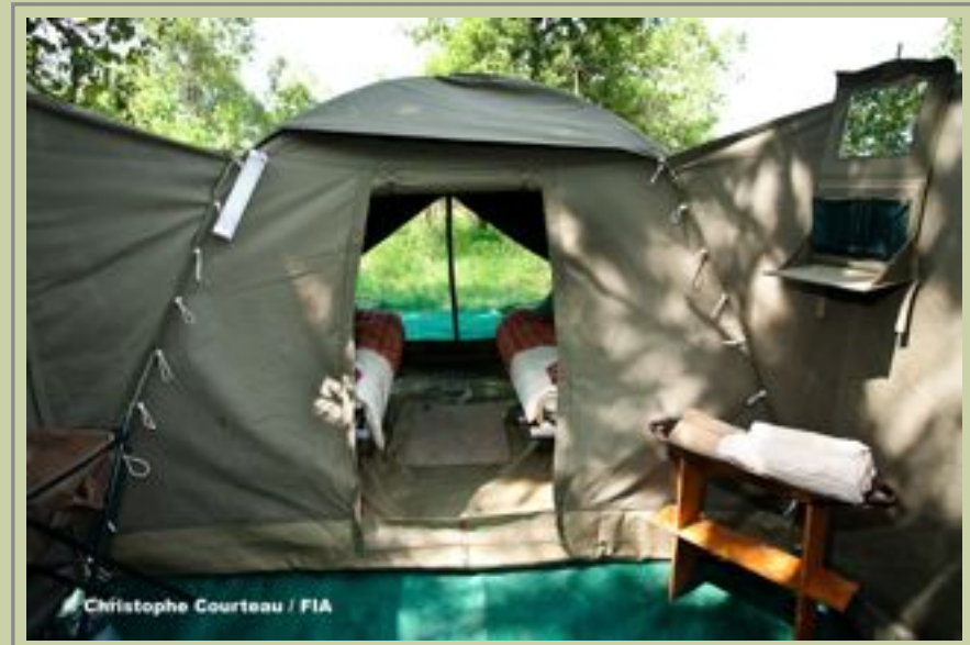
Zelt - Bathroom