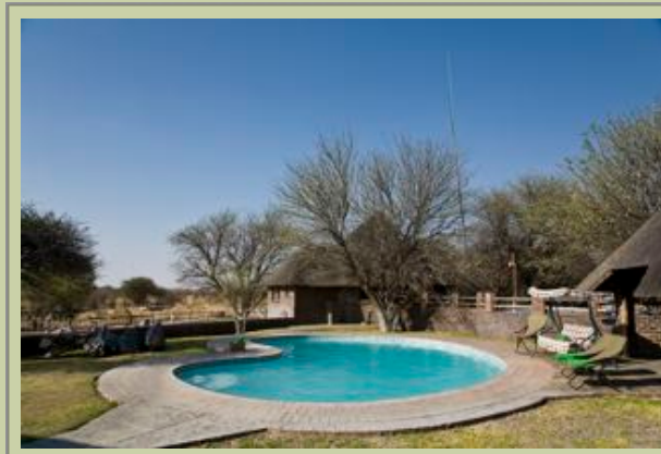
Hauptkomplex - Poolbereich