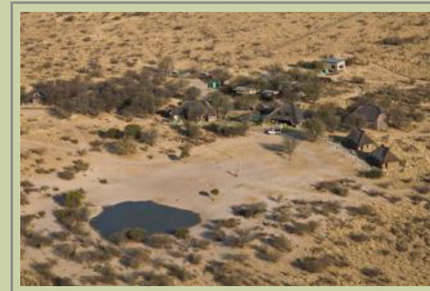
Flugansicht der Lodge