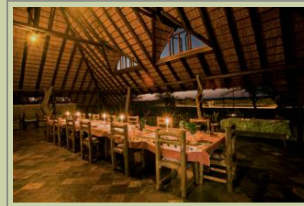
Hauptkomplex - Interior