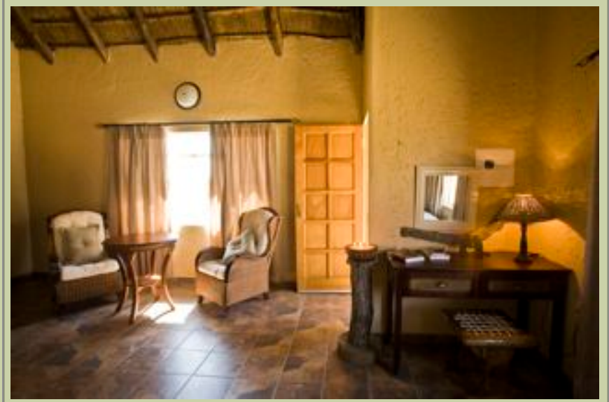
Suite - Lounge