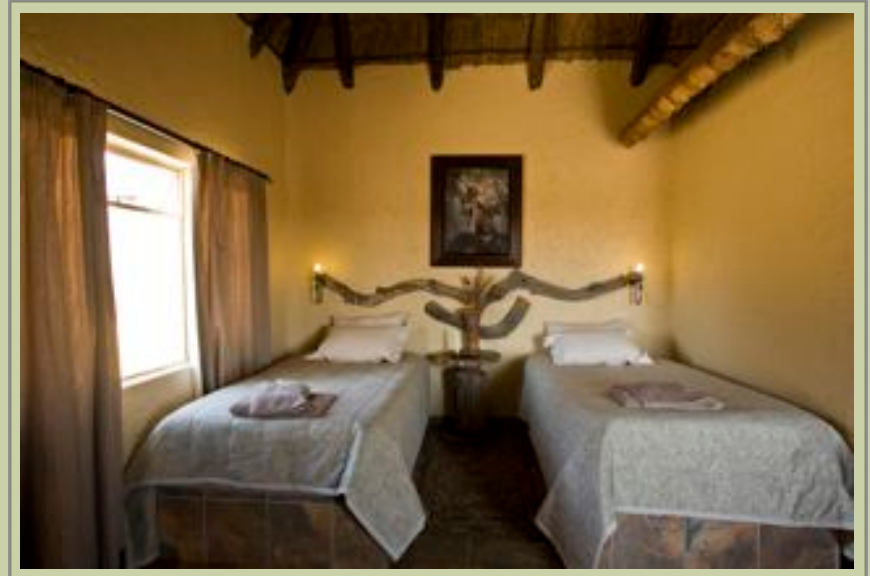
Suite - Bedroom

Die San (Bushmensch) Aktivitäten, und die fünfte Generation Familieneigentümer, die ein enormes Reichtum an Wissen und Geschichte über die Kalahari. anbieten können.