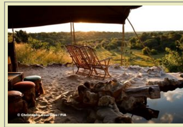
Hauptkomplex - Poolbereich