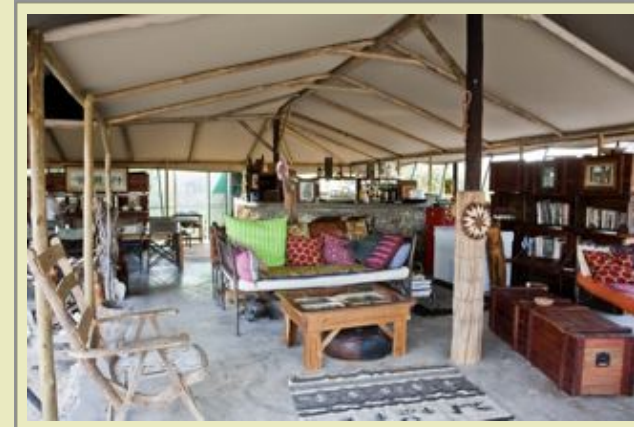
Hauptkomplex - Interior