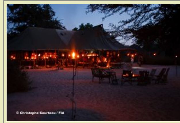
Hauptkomplex - Exterior

Durch Zelttuch geschützte Aussichtspunkte, die sich rundherum des natürlichen Felsenpools befinden, haben Sie einen einzigartigen Blickwinkel über das Flussbett und ein hautnahes Sichtungsversteck bringt die Gäste wirklich nahe zu den Wildtieren und deren Aktivitäten.