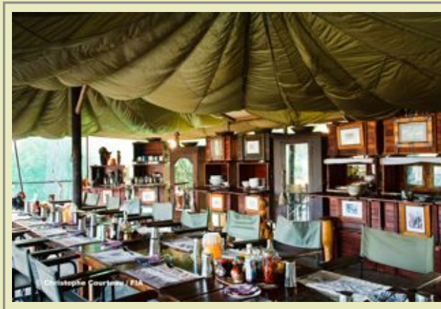
Hauptkomplex - Essbereich