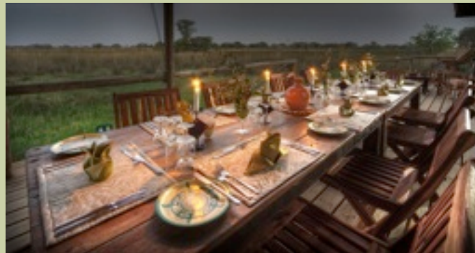
Hauptkomplex - Essbereich