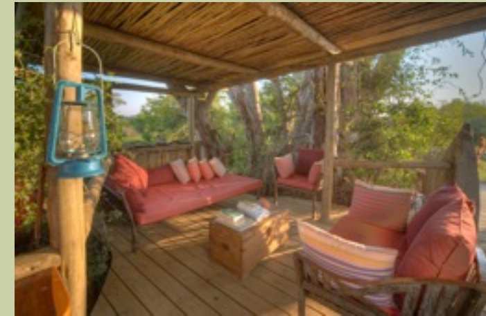
Hauptkomplex - Lounge