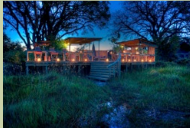
Hauptkomplex - Exterior

Abhängend vom Wasser ist es auch möglich zu zelten.