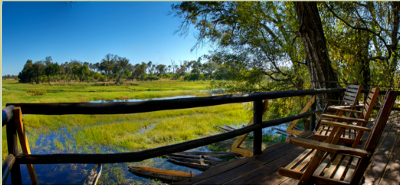
FOOTSTEPS IN AFRICA - BOTSWANA EINFACH & PREISWERT

Wir bieten ein Qualitäts Zeltlager Erlebnis mit Ihrem eigenen Führer, Koch und einfachem Zelt mit Badezimmer.