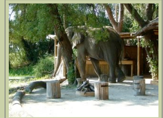
Hauptkomplex - Besuch!