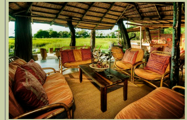
Hauptkomplex - Interior