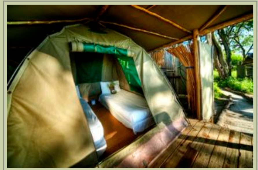
Zelt - Interior

Zeltausrüstung wird zur Verfügung gestellt, aber wir schlagen vor, dass Sie Ihren eigenen Schlafsack bringen.