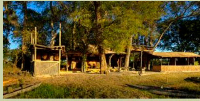
Hauptkomplex - Exterior

Abhängend vom Wasser ist es auch möglich zu zelten.