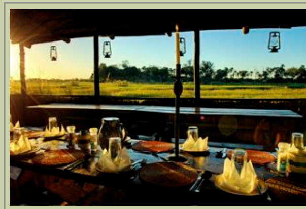
Hauptkomplex - Essbereich