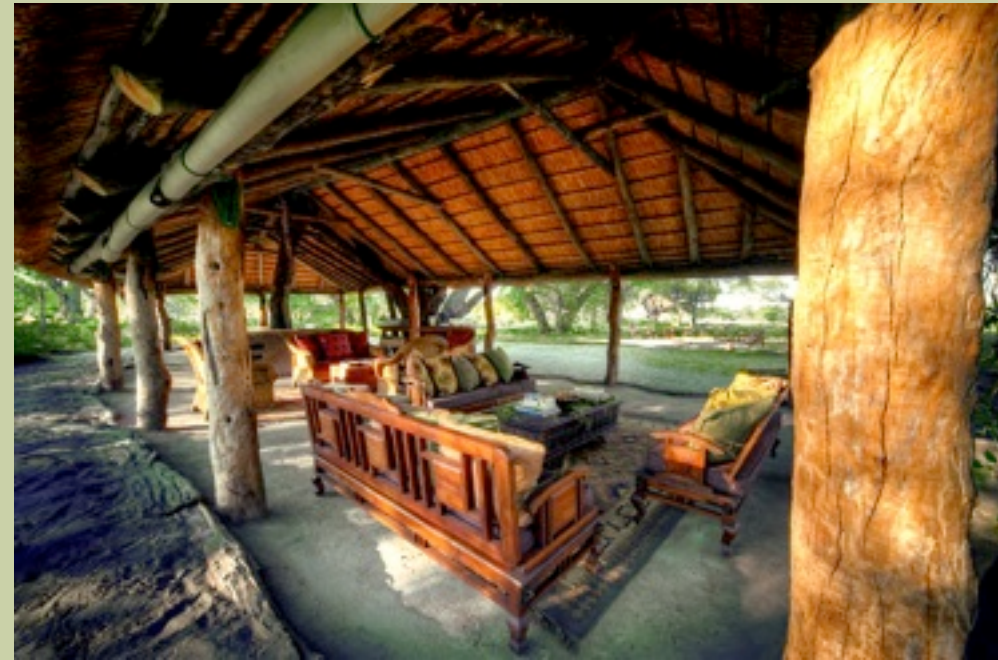
Hauptkomplex - Interior