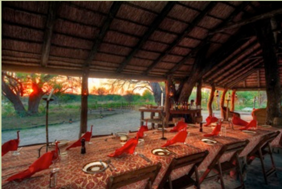
Hauptkomplex - Essbereich