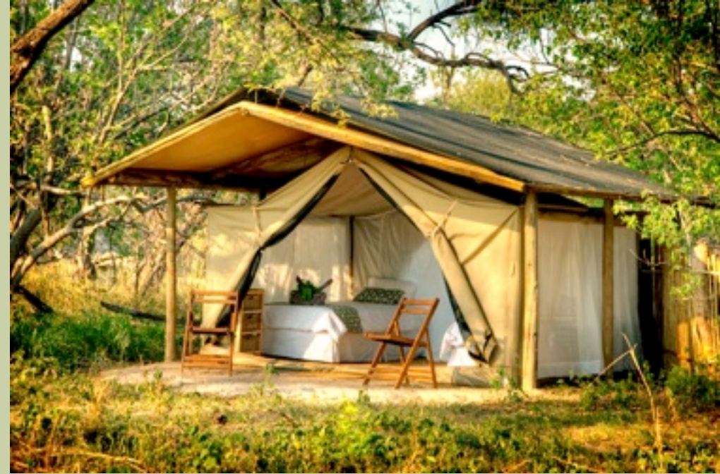
Zelt - Exterior