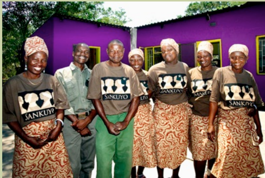
FOOTSTEPS IN AFRICA - BOTSWANA EINFACH & PREISWERT