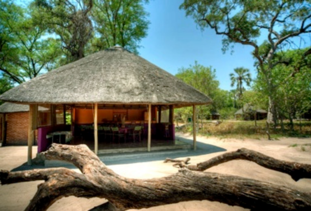
Hauptkomplex - Exterior