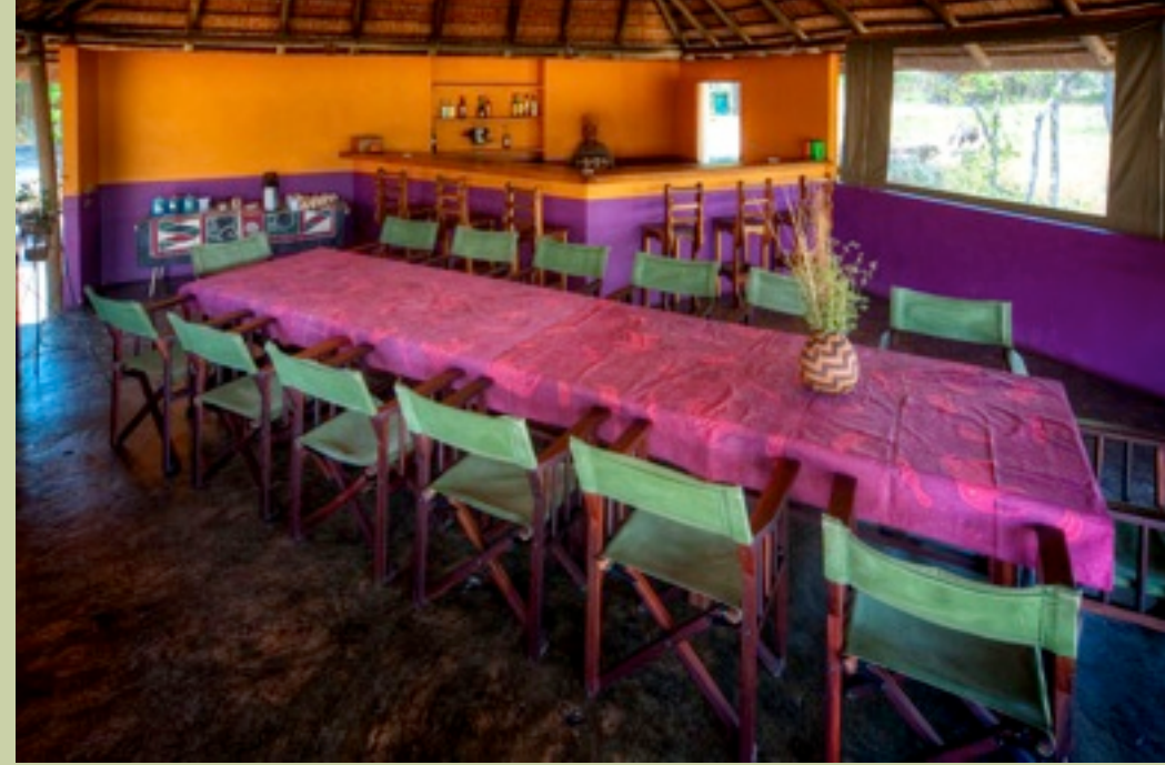
Hauptkomplex - Interior